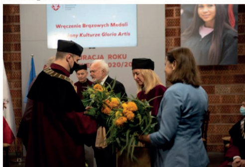
AHE. Inauguracja roku akademickiego Materiały prasowe

W wystąpieniach zwracano uwagę na funkcjonowanie szkół wyższych w czasach pandemii, na coraz intensywniej rozwijającą się formułę kształcenia zdalnego, której Akademia jest pionierem i na platformie Polskiego Uniwersytetu Wirtualnego uczy już od 18 lat.