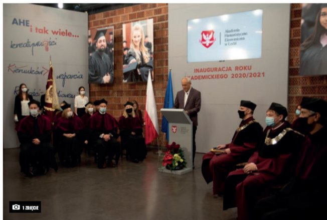
AHE. Inauguracja roku akademickiego (Materiały prasowe)

Już 28. raz Akademia Humanistyczno-Ekonomiczna, najstarsza niepubliczna uczelnia w Łodzi, zainaugurowała nowy rok akademicki.