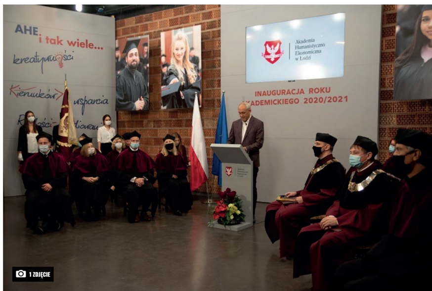
AHE. Inauguracja roku akademickiego (Materiały prasowe)

Już 28. raz Akademia Humanistyczno-Ekonomiczna, najstarsza niepubliczna uczelnia w Łodzi, zainaugurowała nowy rok akademicki.