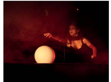
32. Ogólnopolskie Konfrontacje Teatrów Młodzieżowych dzień pierwszy